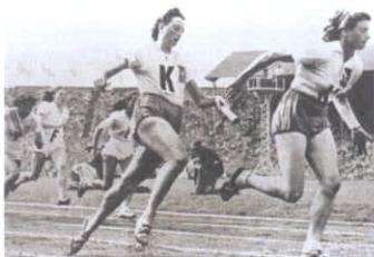
IOC - www.olympic.org

Atletiek wordt gezien als de moeder van alle sporten. De oermens begon al met hardlopen, springen en gooien om voedsel te verzamelen en te overleven. Via de Olympische spelen van Griekse oudheid ontwikkelde atletiek zich langzaam tot een echte sport.